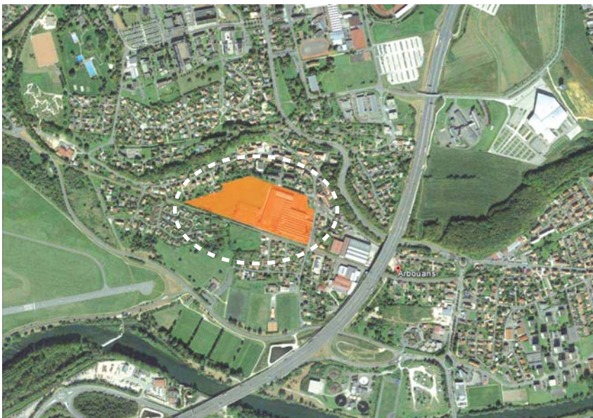
Le site de la SED à l'échelle de la commune.

«C'est un super projet qui va accentuer la centralité d'Arbouans, densifier et dynamiser le centre bourg et apporter une population nouvelle, avec une vraie cohérence...»