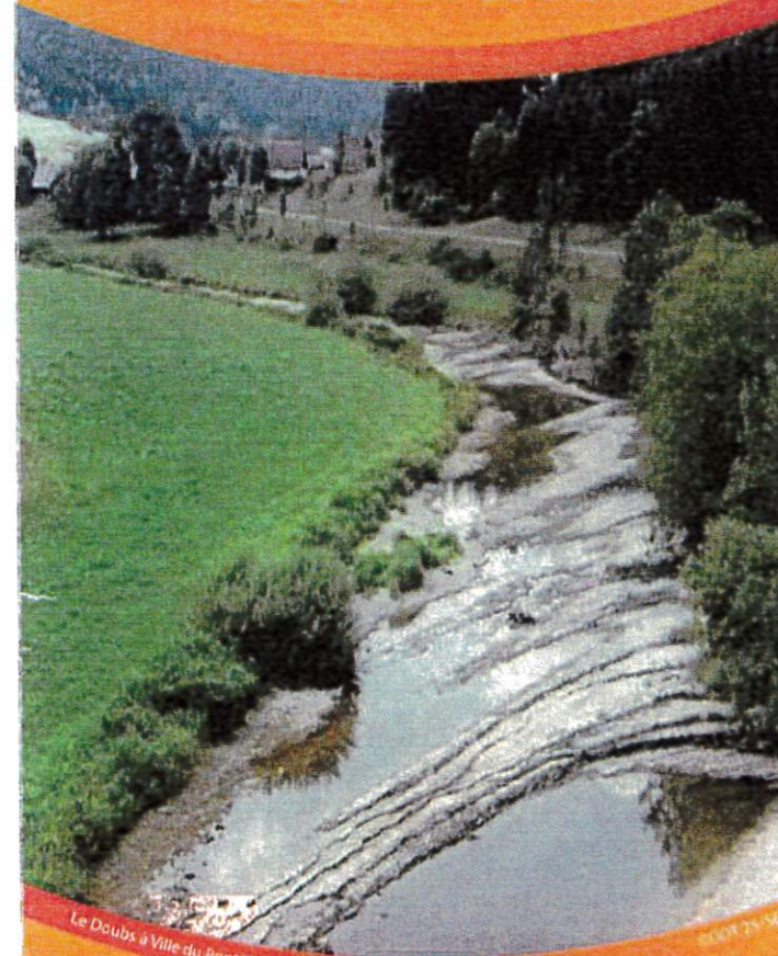
Le Doubs à Ville du Port 10/2018