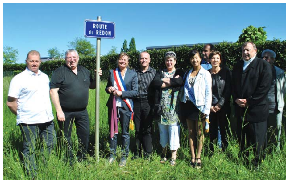
La plaque a été dévoilée en présence des élus et des riverains.

des Aviateurs, la route Oehmichen et bien d'autres. En fait, le Redon a été choisi parce que la rue est située au lieu-dit Le Redon, ce terme définissant un système de drainage existant dans cette zone riveraine du Doubs, système