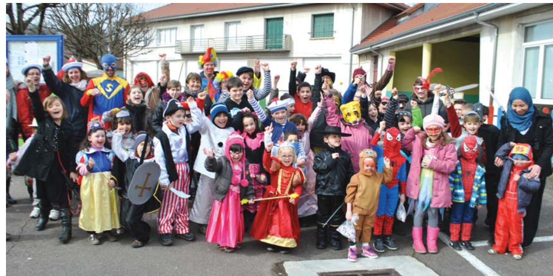
Tous les participants à la cavalcade ont posé avant le départ du défilé.