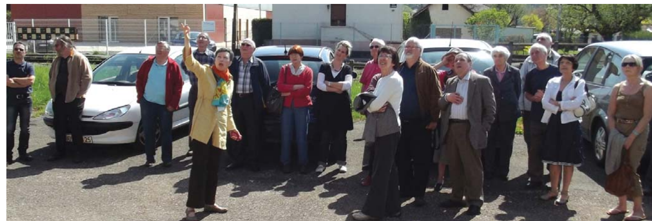
Construite dans les années 1950 rue du Stade, la chapelle d'Arbouans a suscité l'intérêt d'un nombreux public.