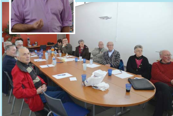
Les participants au stage et leur animateur (en médaillon).

Une quinzaine de personnes ont participé récemment à un stage organisé par le CCAS d'Arbouans et le Comité Départemental de la Prévention Routière. Ce stage, réservé aux seniors, a permis d'évoquer de nombreux points, par exemple l'autonomie et la mobilité en voiture, mais aussi les statistiques liées au comportement des seniors sur la route. Un point a également été fait sur les évolutions de la réglementation, des informations bien utiles pour des automobilistes ayant obtenu leur permis de conduire il y a maintenant plusieurs décennies.