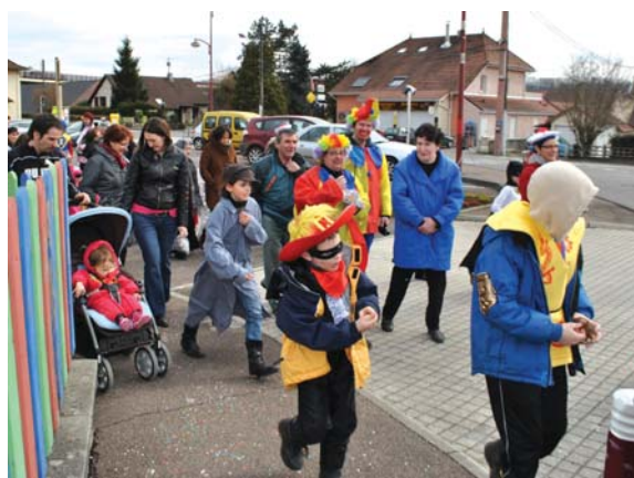
Malgré des conditions météo plutôt fraîches, le Carnaval s'est déroulé dans la bonne humeur.