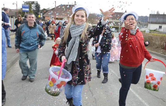
Sous une pluie de confettis...

Après cette parade, tout le monde s'est retrouvé à la Salle polyvalente pour déguster les beignets de Carnaval accompagnés de jus de fruits et de boissons chaudes.