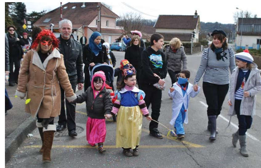
Parti des écoles, le cortège a défilé dans quelques rues du village...